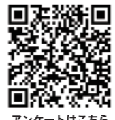
アンケートはこちら

障がいのあるアーティストたちによりデザインされた素敵なグッズの詰め合わせ2種類から、抽選で50名様にプレゼント。みんな芸のイベントに参加したら、アンケートに答えてGETしよう！